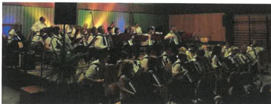
Beide Orchester bei einem der letzten Gemeinschaftskonzerte

Eintritt: 10 EUR / 5 EUR ermäßigt (Schüler/Studenten)